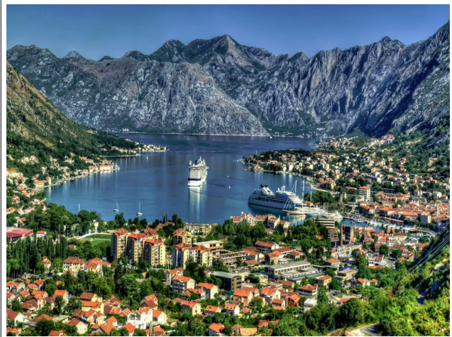
Kotor Bay & its climbs