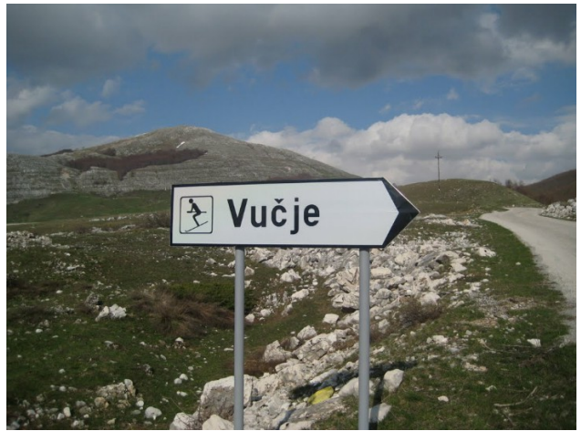
Krnovo (Vučje ski centar)