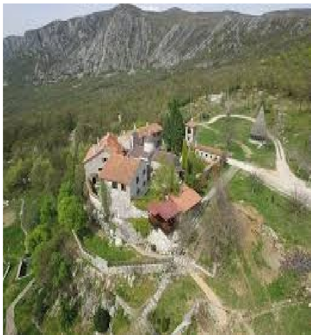
Manastir Ćelija Piperska