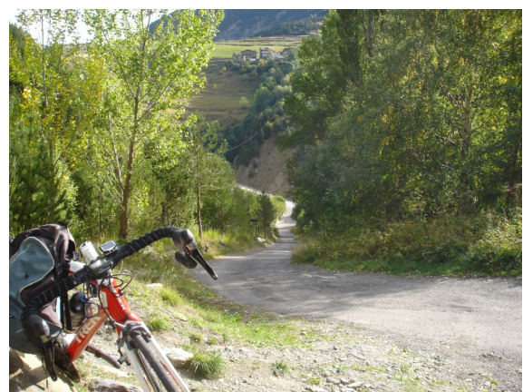
Camí del Riu d'Urina