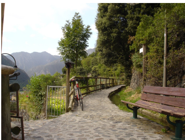
Rec de Solà

Proef het prachtige uitzicht op de stad van Andorra op de paden van Rec de Solà, van de zeer korte Urina,