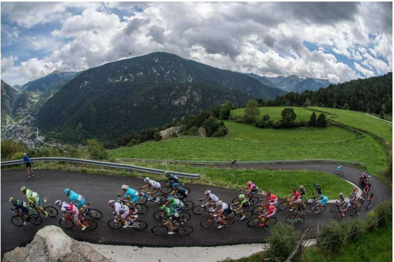
Het Vuelta in Andorra