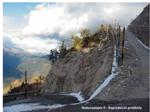
Pic de Carroi

Proef het prachtige uitzicht op de stad van Andorra op de paden van Rec de Solà, van de zeer korte Urina,