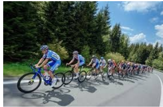
Course de la Paix