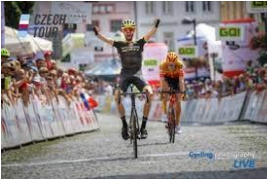
Tour de Tchèque