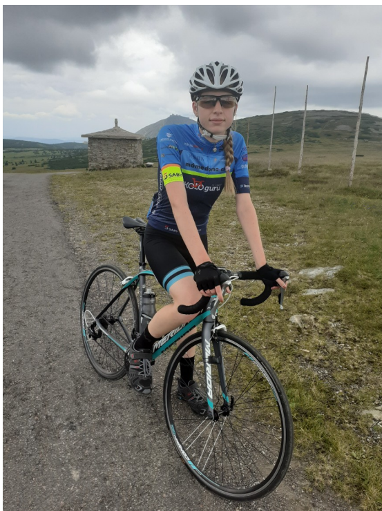
Modré sedlo (1510m)

des altitudes au-dessus de 1000m dans les montagnes,