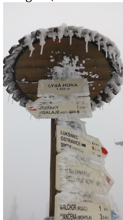
Lysa Hora (1323m)

* une montée empruntant une classique de cyclo-cross ,des paradis de Bohême ou de splendides paysages dans le massif du Jeseniky,