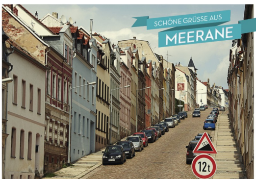
Bekannt Wand von Meerane