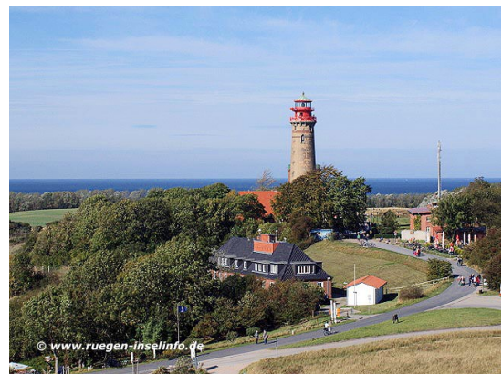
Kap Arkona, Ostsee

Die nationale Challenge legt großen Wert auf Sehenswürdigkeiten. Unter ihnen sind einige im UNESCO Weltkulturerbe aufgeführt: das Mittelrheintal (mit Loreley), die Rokoko-Kirche von Wies, die Stadt Bamberg, die Wartburg, Wilhelmshöhe in der Nähe von Kassel.