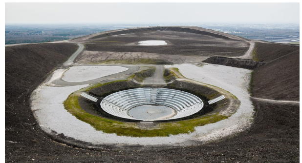
Das "Amphitheater" Halde Haniel