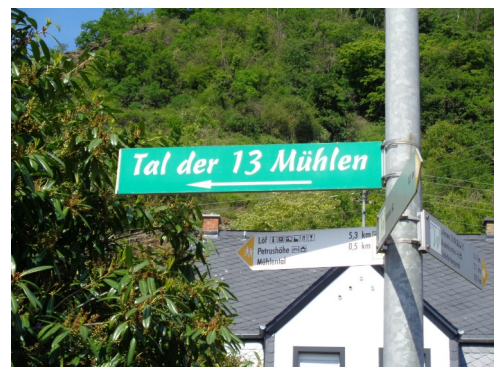
Tal der 13 Mühlen