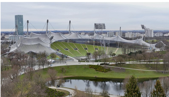
Olympiabergrg : le mont du site olympique