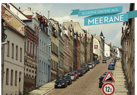
Le fameux mur médiatique de Meerane