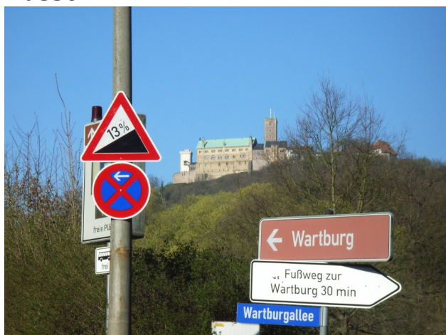
Forteresse de Wartburg

Le Brevet accorde une très large place aux sites touristiques. Parmi eux, plusieurs sont inscrits au Patrimoine Mondial de l'UNESCO : la Vallée du Haut-Rhin Moyen (dont la Loreley), l'église rococo de Wies, la ville de Bamberg, la forteresse de Wartburg, le Parc Wilhelmshöhe à Kassel.