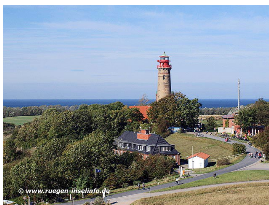
Kap Arkona : l'Allemagne en bord de mer

Le Brevet accorde une très large place aux sites touristiques. Parmi eux, plusieurs sont inscrits au Patrimoine Mondial de l'UNESCO : la Vallée du Haut-Rhin Moyen (dont la Loreley), l'église rococo de Wies, la ville de Bamberg, la forteresse de Wartburg, le Parc Wilhelmshöhe à Kassel.