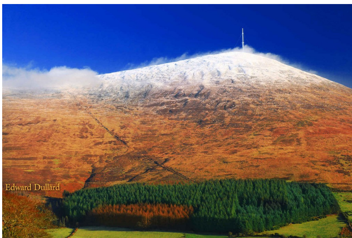
Le Mont Leinster

Le Graal est donc à chercher sur les flancs de ce dernier et de ses 3 derniers km à plus de 11%, avec un passage à 15. Il vaut 750 Europoints. A titre comparatif, le Mont Faron en vaut 625 et le Stockeu 251. Dans la Superliste, le très exigeant Mullaghanish (531pts) est plus « facile ».