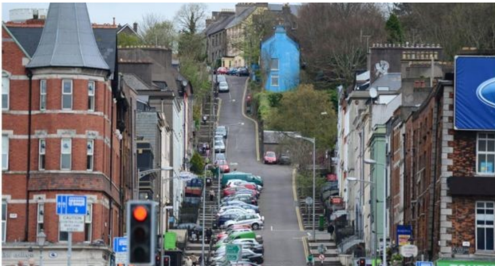
St Patrick's Hill

De 1985 à 1992, un Tour d'Irlande a été organisé sous l'appellation « Nissan Classic ». Seskin Hill et St Patrick's Hill faisaient très régulièrement partie des « Grimpeurs ». Et un très étonnant Cairmont Cairn, dans lequel Roche, Breukink et Armstrong se sont illustrés en 1992.