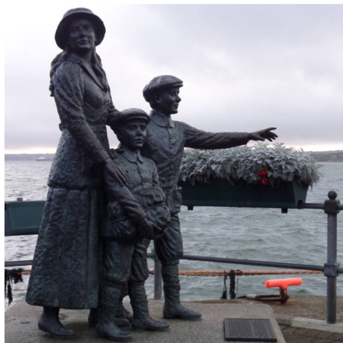
Statue d'Annie Moore et de ses deux frères à Cobh, symbole de l'émigration irlandaise aux Etats-Unis

3 ascensions témoignent de l'histoire moderne. Le monument de Knockfierna commémore la « Grande Famine » qui a frappé l'Irlande au milieu du XIX e siècle. Le Mont Crozier domine Cobh, port d'où est parti le Titanic. Plusieurs statues et un musée (Titanic Experience) se situent sur le quai, au pied du mont. L'immigration irlandaise vers les Etats-Unis est également rappelée dans une pierre gravée, près d'un pont, au pied du Muckish Gap. Enfin, le musée dédié à Michael Collins, l'une des figures majeures de la Guerre civile dans les années 1920.