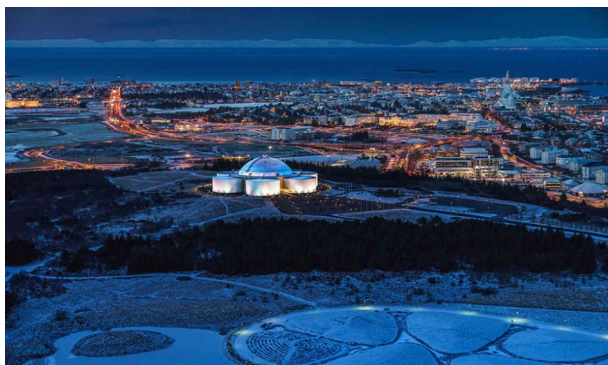
Perlan by night

Dans l'autre sens, le Top 4 des plus faciles, dont l'intérêt est touristique : 008-Látrabjarg (falaise et réserve ornithologique, 25m), 038-Reykjanesviti (le plus vieux phare de l'île, 30m), 079-Dettifoss (cataracte impressionnante, 43m) et 033-Perlan (vue panoramique sur Reykjavik, 49m).