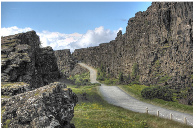
Almannagjá dans le P.N. de Þingvellir

L'Histoire est peu représentée. Outre la faille tectonique, le Parc National de Þingvellir abrite également les ruines du premier parlement européen (Alþing, qui remonte à 930).