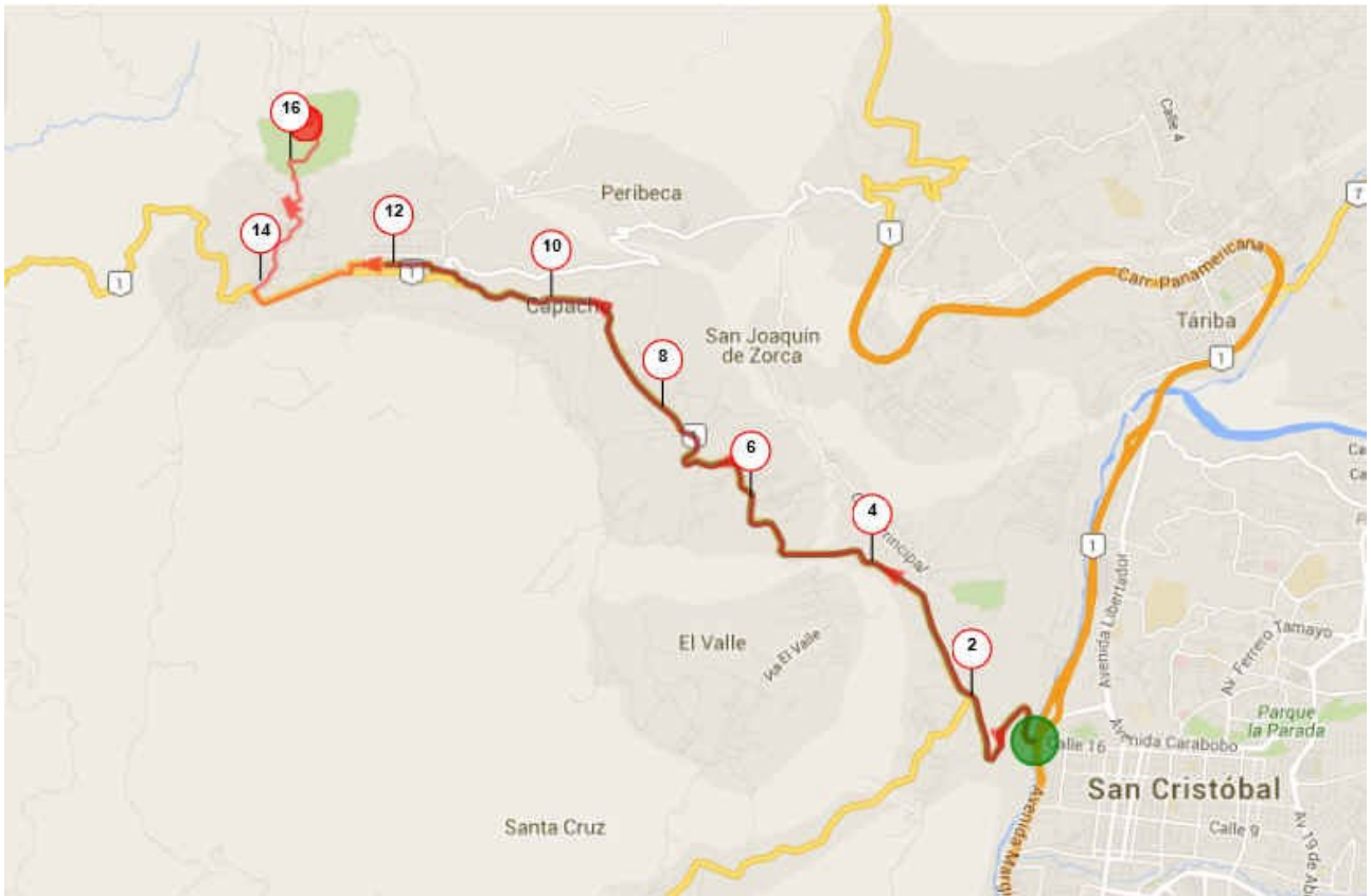
Route tracée sur Openrunner