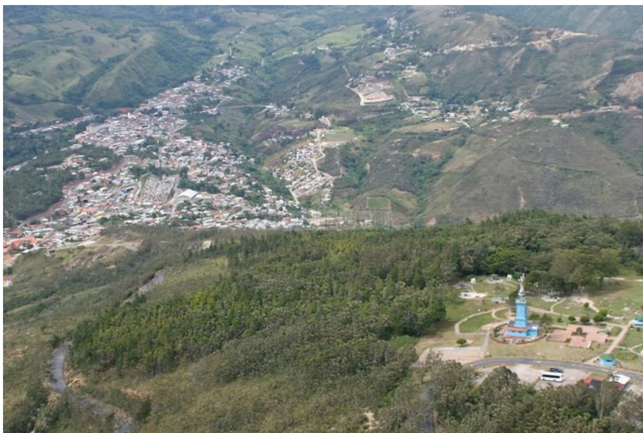
Mise en perspective aérienne du sommet et de Capacho, dans la vallée

Pour inaugurer cette rubrique, direction l'ouest du Venezuela et la région du Táchira, dont la ville principale, San Cristóbal, a accueilli les Championnats du Monde de cyclisme sur route en 1977.