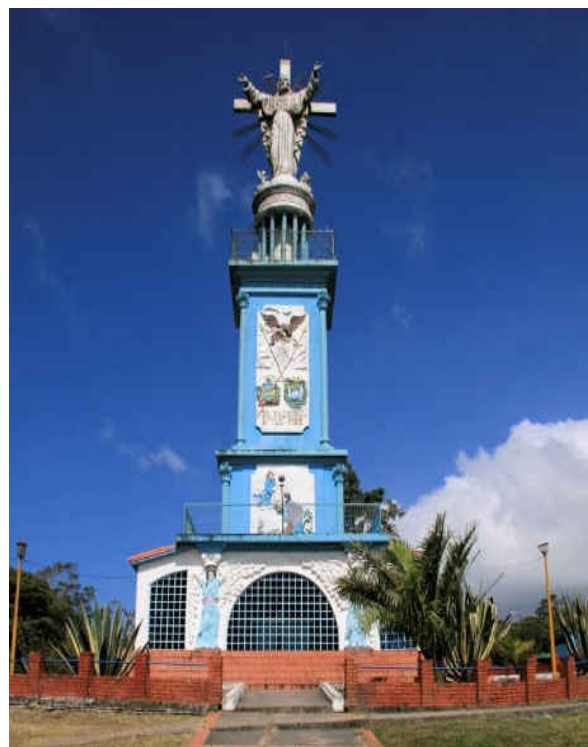
25m de dénivellation supplémentaire

https://es.wikipedia.org/wiki/Monumento_Cristo_Rey