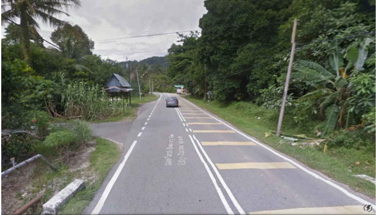
Au pied, l'une des très rares lignes droites de cette « Alzheimer Hill »

1- 28km pour passer de 63 à 668m (+/- 2% de moyenne)