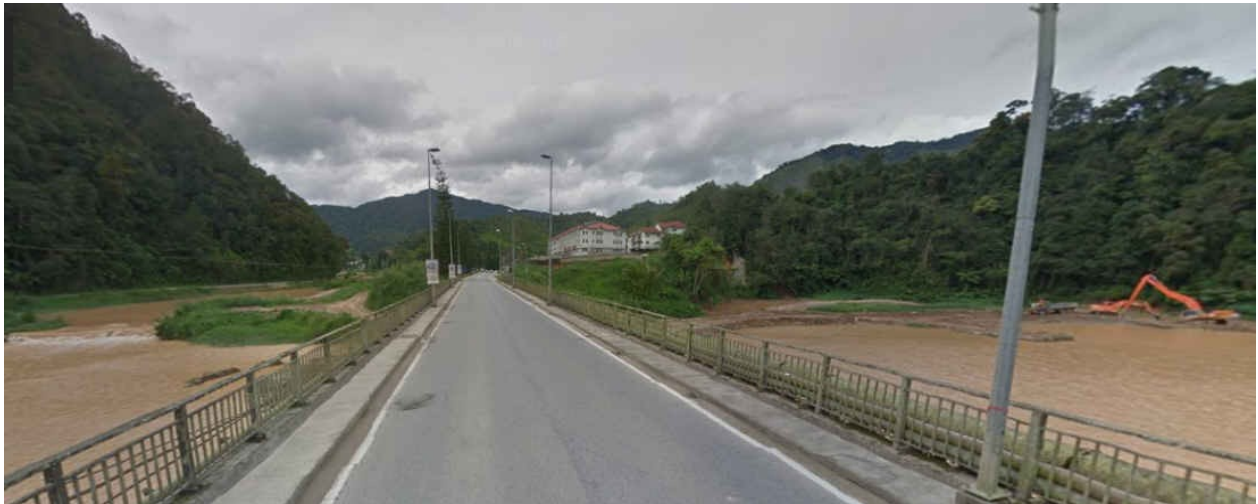
Passage sur le lac à la sortie de Ringlet

3- 5,5km ondulés à tendance descendante (1155-1081m)