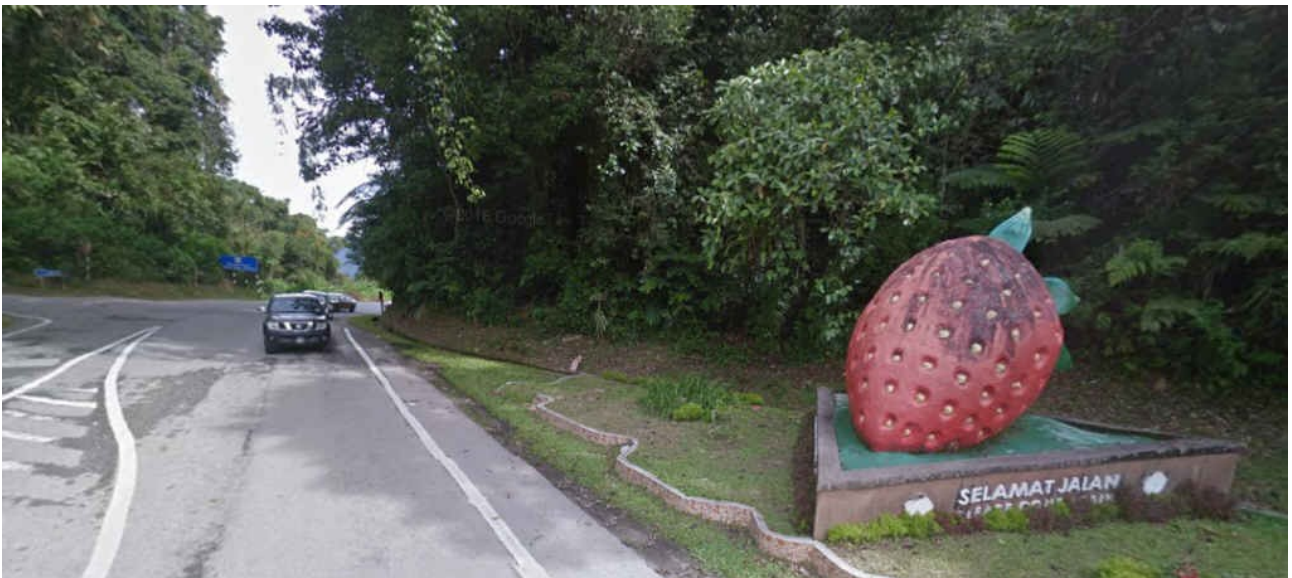
Carrefour au sommet de Ringlet : la fraise sur le gâteau

Pourcentages km : 3,1 3,2 3,4 3,5 6,0 / 4,3 5,4 5,1 4,6 4,2 3,2 5,4/2