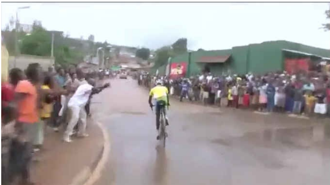
Welcome to hell !