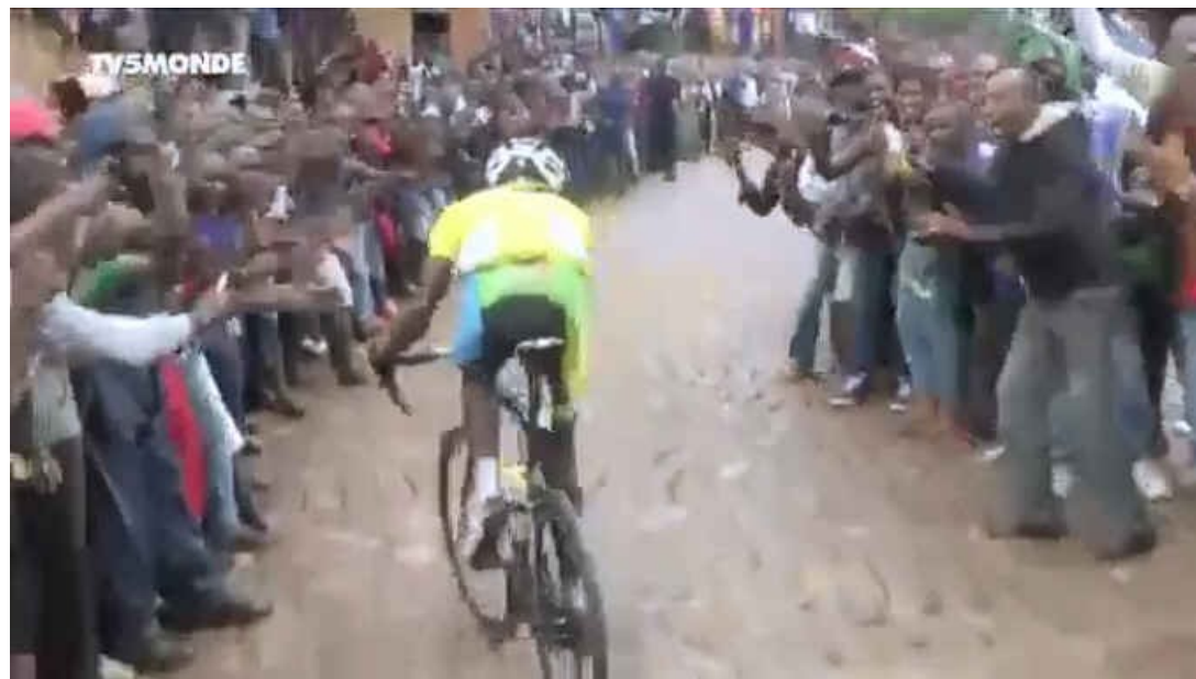
Even the Yellow Jersey climbs with great difficulty