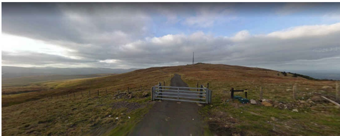
Sommet de Slieve Gallion

7 autres épouvantails offrent une difficulté supérieure au 251 points du Stockeu: Slieve Gallion (372pts), Divis (361pts), Slieve Croob (352pts), Bernish Rock (348pts), Torr Head (304pts), Binevenagh (300pts) et Sperrin (261pts).