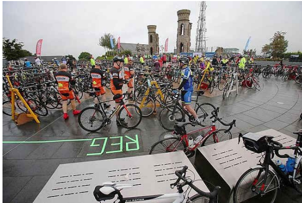
Départ de Lap of the Lough

A Dungannon, le départ et l'arrivée de la Lap of the Lough (Neagh) sont situés au sommet de Hill of the O'Neill.