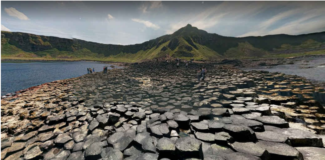
La Chaussée du Géant

La perle touristique: les 40.000 colonnes basaltiques de Giant's Causeway, inscrites au Patrimoine de l'Humanité de l'UNESCO.