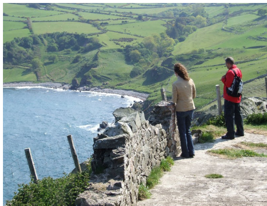
Torr Head panorama