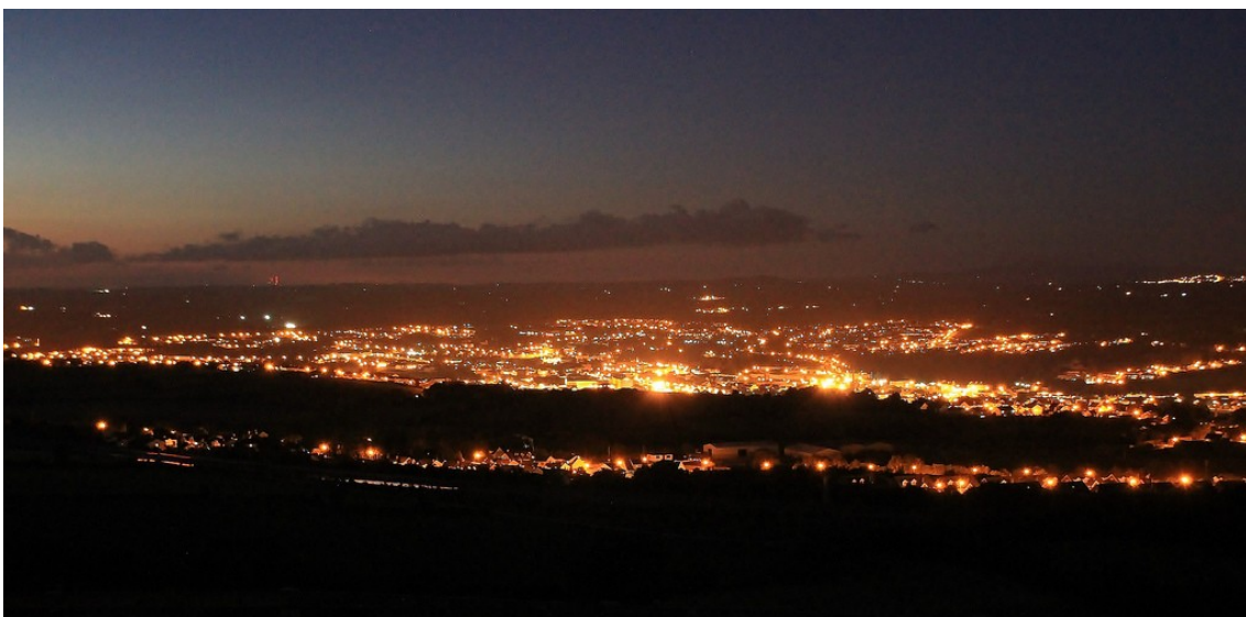
Newry by night à partir de Bernish Viewpoint

D'autres lieux méritent le détour: Slieve Croob, qui a reçu le label « AONB » (« Area of Outstanding Natural Beauty »). Le mont domine la région des Dromara Hills et recèle quelques vestiges celtes, dont un traditionnel « cairn ». Torr Head est un cap que l'on atteint au terme d'une somptueuse route panoramique à dénivellation. Il fait l'objet d'une cyclo sportive (Torr Head Challenge). Bernish Viewpoint offre un point de vue sur Newry, l'un des plus beaux d'Irlande (selon le Guide Vert). On y trouve aussi une tombe celte.