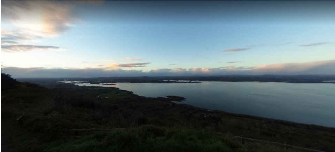
Le Lough Erne vu des Falaises de Magho

-Le Lough Erne (Lower et Upper) se déroule sur 75km dans le sud-ouest. C'est à partir des Cliffs of Magho qu'on l'appréciera au mieux.