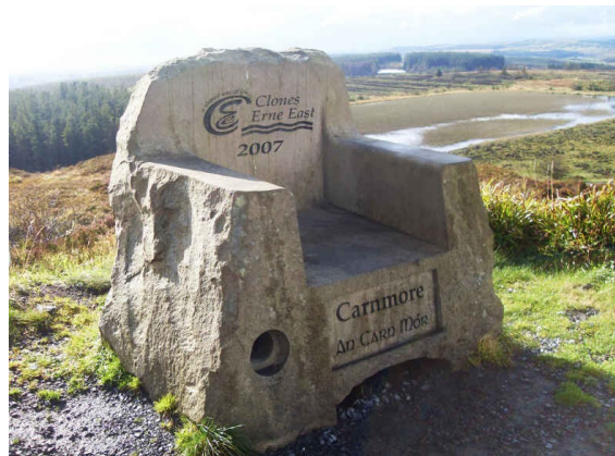
Carnmore Stone Chair