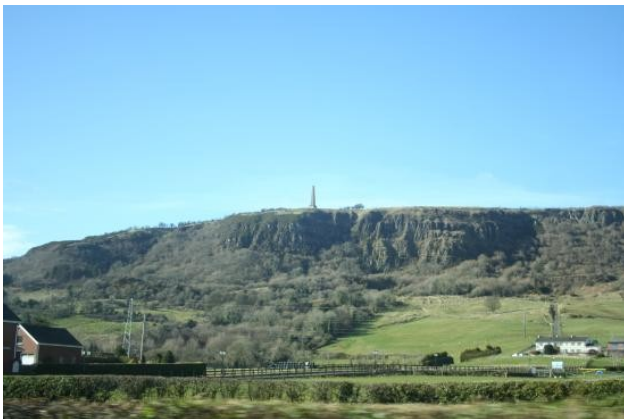
Falaise de Knockagh

Au nord de Belfast, un mémorial de la deuxième guerre mondiale domine la colline de Knockagh. Un mémorial aux victimes du Bloody Sunday sert de départ à l'ascension de Springhill, à Londonderry/Derry. Le château de Dungannon a été construit au XIV e siècle. Il fut le siège de la dynastie O'Neill qui régna sur l'Ulster pendant trois siècles. Il paraît que, par beau temps, on y voit les sept comtés sous domination familiale. Enfin, une très originale chaise en pierre trône sur le point de vue de Carnmore. Elle fait partie d'une promenade pédestre de 10km (Sleave Beagh Walk) qui s'inscrit dans un projet transfrontalier (Clones Erne East Blackwater).