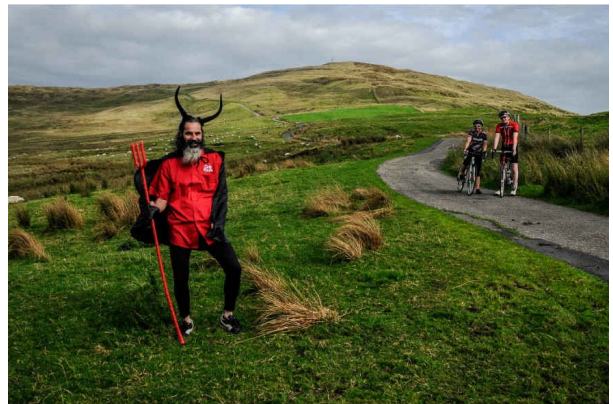
Diabolique Slieve Croob

Slieve Croob et Windy Gap sont des incontournables du sud de Belfast, notamment dans la sportive Dromara Hilly (125km). Jusqu'à son sommet en cul-de-sac, la première fait également l'objet d'une Hill Climb.