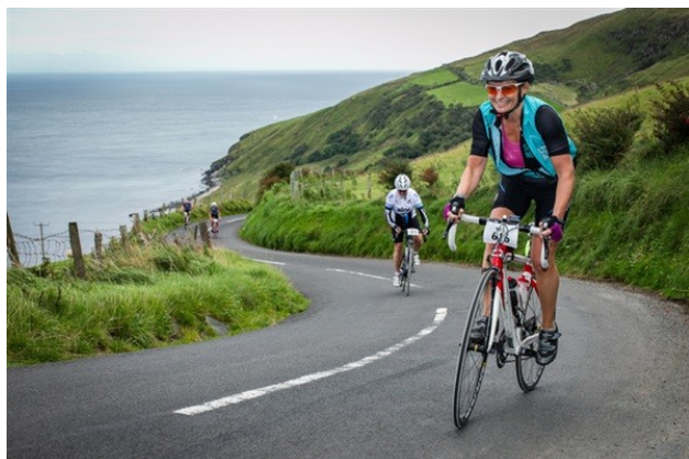
Torr Head Challenge

Très peu de côtes à plus de 10km: Spelga Dam (14km), Slieve Croob (13km) et Glenariff (12km). Seul Torr Head (9,4%) et Brougher Mt. (9,3%) ont un pourcentage moyen supérieur à 9%. Les autres tournent autour de la moyenne (5%).