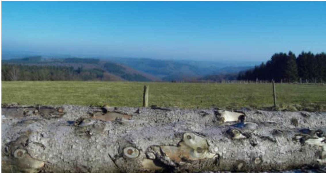
Vue du sommet du Corbion