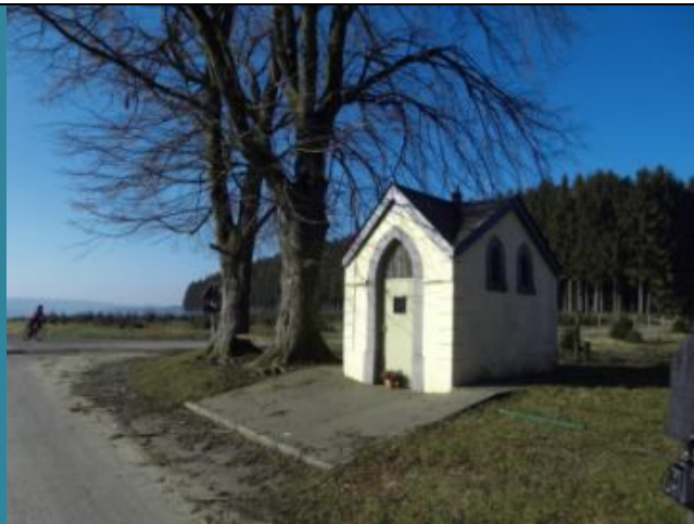
Col de Sati