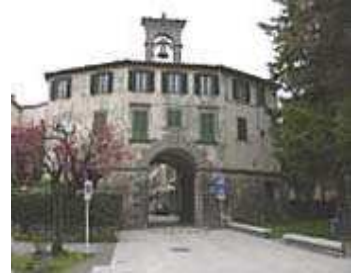
Firenzuola: Porta Fiorentina

Si scende poi a Firenzuola (m. 422) da cui si risale al Passo della Futa, passando per i piccoli borghi di Cornacchiaia e Castro S.Martino.